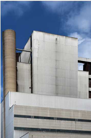
Kraftwerk Neurath: Kesselhaus Block E, Ansicht von Süden; Foto: 12.09.2023