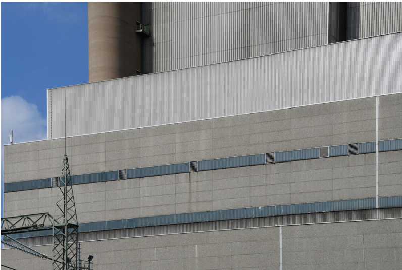
Kraftwerk Neurath: Zwischenbau Block E, Ansicht von Süden; Foto: 12.09.2023