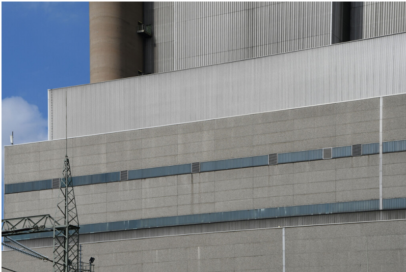
Kraftwerk Neurath: Zwischenbau Block E, Ansicht von Süden