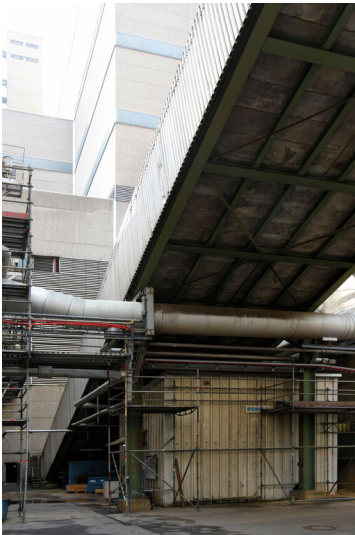
Kraftwerk Neurath: Bekohlungsweg Brecherei - Blöcke D/E, Ausgang der Schrägbandbrücke aus dem Brechereigebäude, Ansicht von Westen