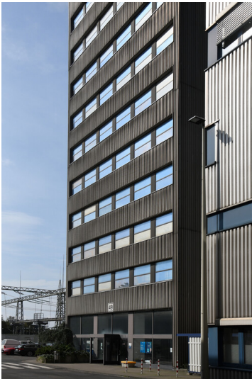
Kraftwerk Neurath: Bekohlungsverbau, Eingang und Bürogeschosse im unteren Gebäudebereich, Ansicht von Nordosten