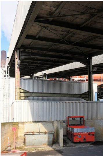
Kraftwerk Neurath: Schrägbandbrücke zwischen Eisenausscheidung und Brecherei, Brückenkonstruktion und Einfeldträger, Ansicht von Osten; Foto: 12.09.2023