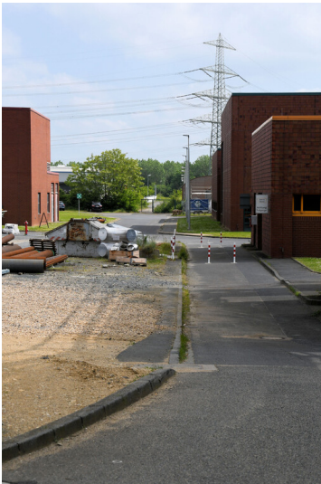
Kraftwerk Goldenberg-Werk: Verlauf der Werkstraße (11) in Richtung Kreuzung mit der Kasinostraße, Ansicht von Südwesten