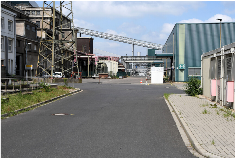
Kraftwerk Goldenberg-Werk: Werkstraße (8) vor der 25-kV-Schaltanlage, Ansicht von Südosten; Foto: 25.05.2023