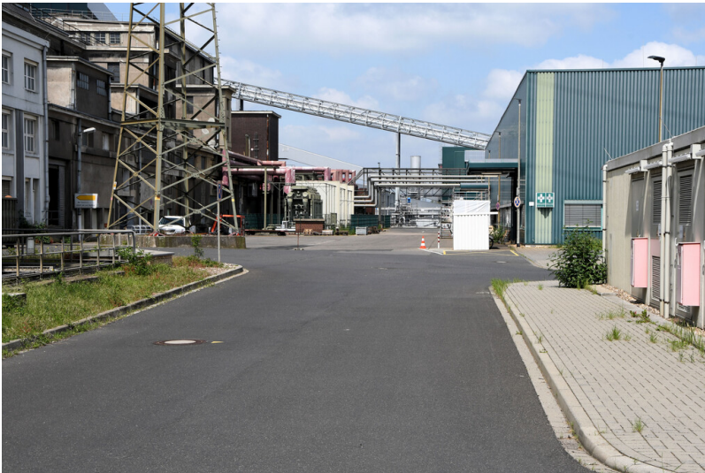
Kraftwerk Goldenberg-Werk: Werkstraße (8) vor der 25-kV-Schaltanlage, Ansicht von Südosten