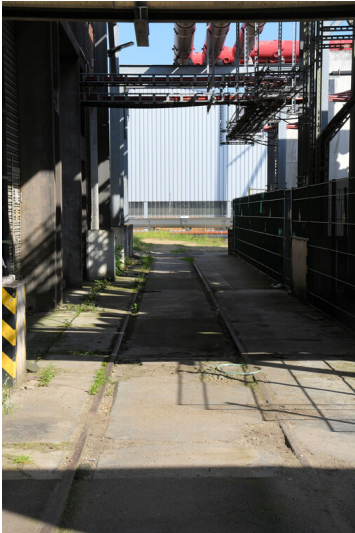
Kraftwerk Goldenberg-Werk: Trafogleis vor dem Schaltanlagenvorbau (links), Ansicht von Südosten