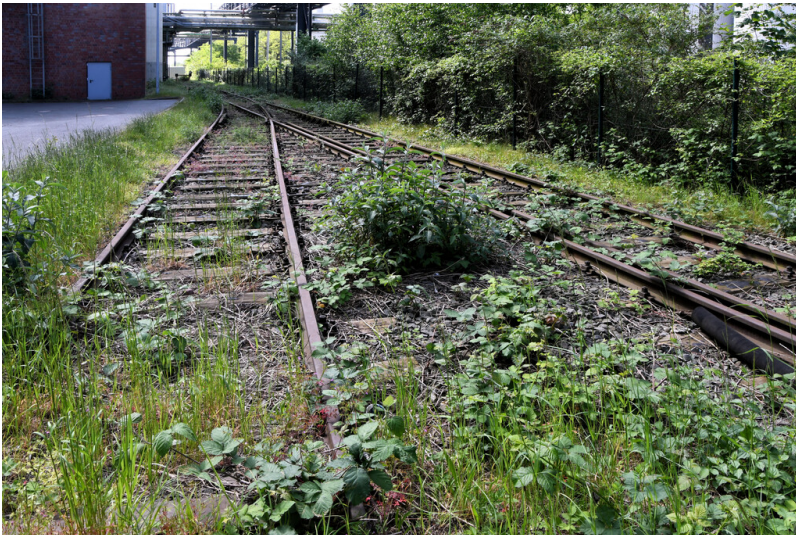
Kraftwerk Goldenberg-Werk: Abzweig der Gleiszufahrt zur Öl-/Kalkübernahme (links) von dem im Südwesten verlaufenden Kraftwerksgleis, Ansicht von Nordwesten; Foto: 25.05.2023