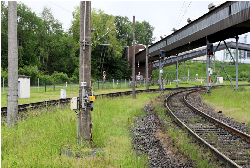
Kraftwerk Goldenberg-Werk: Abzweig des Vorbeifahrgleises (links) vom Zufahrtsgleis zum Grabenbunker Gotteshülfe (rechts), Ansicht von Nordosten