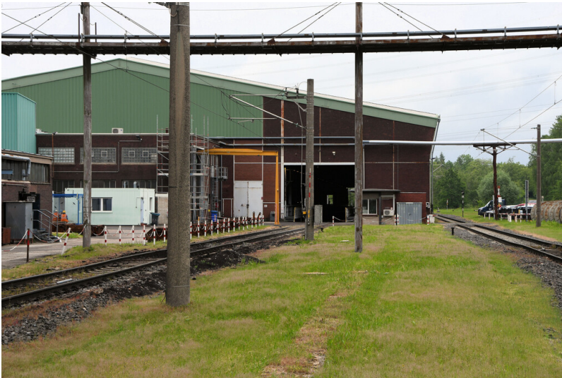
Kraftwerk Goldenberg-Werk: Gleisanlage am Grabenbunker Gotteshölfe mit Einfahrgleis (links) und Vorbeifahrgleis (rechts), Ansicht von Südwesten; Foto: 23.05.2023