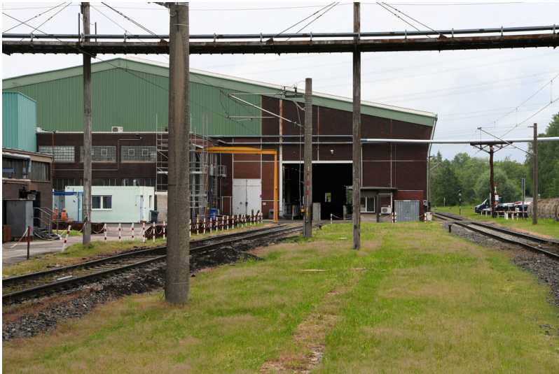
Kraftwerk Goldenberg-Werk: Gleisanlage am Grabenbunker Gotteshölfe mit Einfahrgleis (links) und Vorbeifahrgleis (rechts), Ansicht von Südwesten; Foto: 23.05.2023