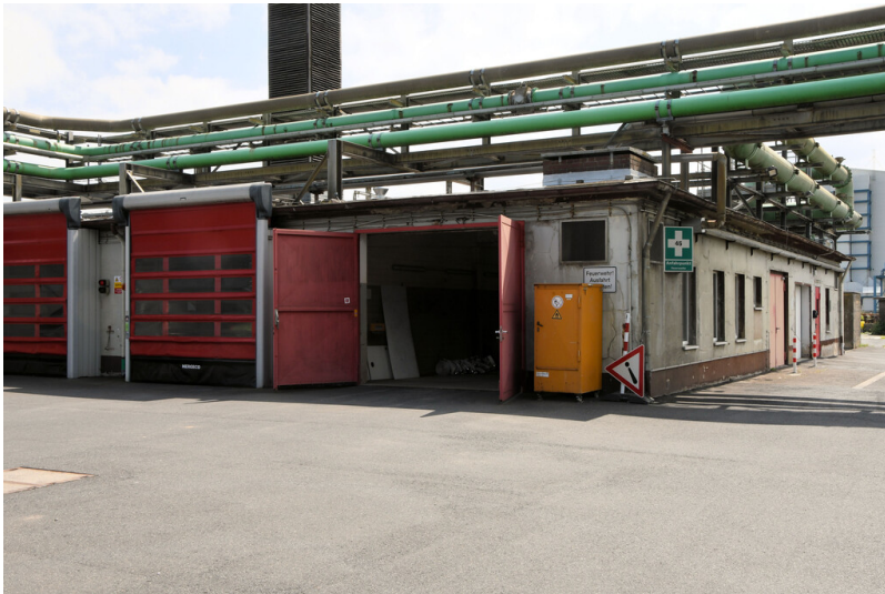
Kraftwerk Goldenberg-Werk: Feuerwehr-Gebäude, Ansicht von Westen