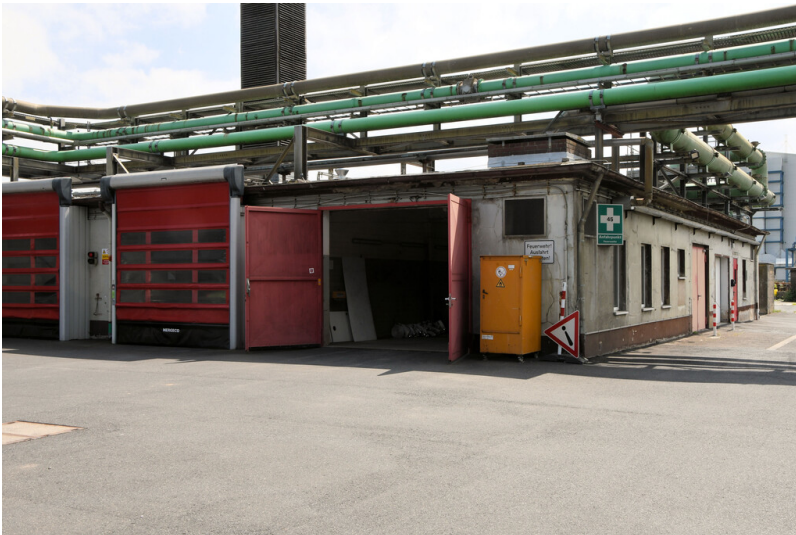
Kraftwerk Goldenberg-Werk: Feuerwehr-Gebäude, Ansicht von Westen; Foto: 25.05.2023