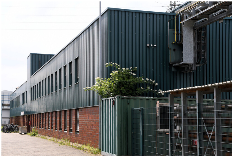
Kraftwerk Goldenberg-Werk: Verwaltung, Ansicht von Nordwesten; Foto: 25.05.2023