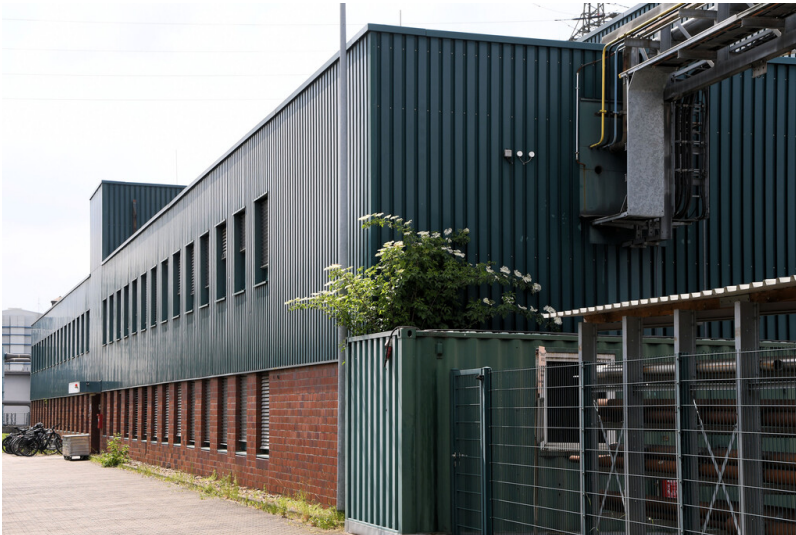
Kraftwerk Goldenberg-Werk: Verwaltung, Ansicht von Nordwesten; Foto: 25.05.2023