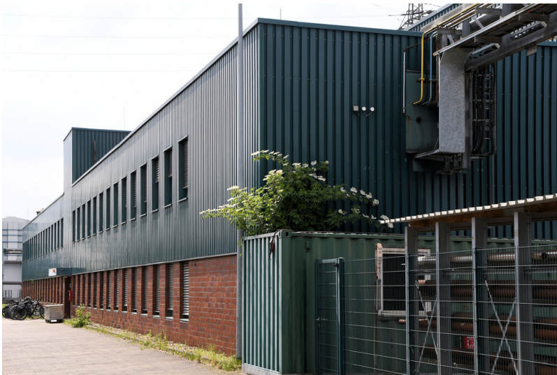
Kraftwerk Goldenberg-Werk: Verwaltung, Ansicht von Nordwesten; Foto: 25.05.2023