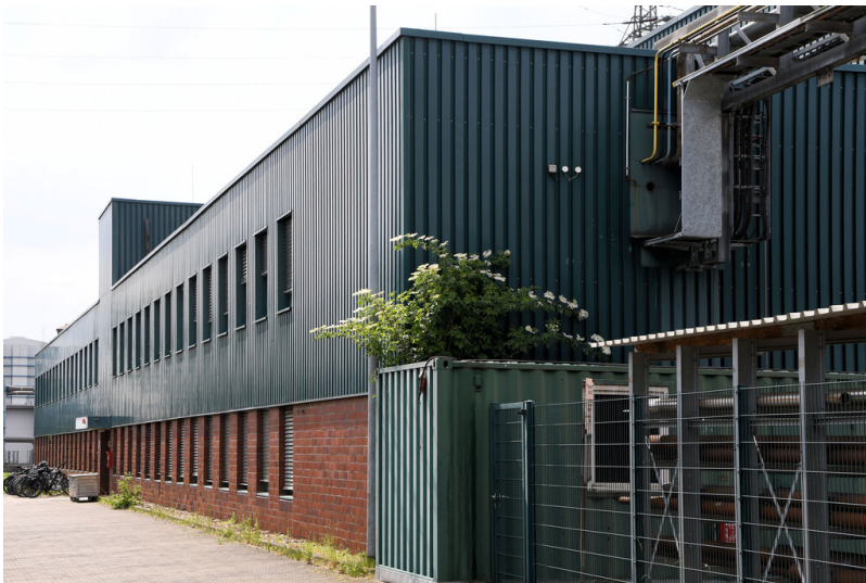
Kraftwerk Goldenberg-Werk: Verwaltung, Ansicht von Nordwesten; Foto: 25.05.2023