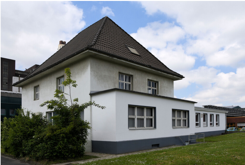
Kraftwerk Goldenberg-Werk: Haus 25 (ehemaliges Betriebsleiter-Wohnhaus) mit Anbau, Ansicht von Osten; Foto: 25.05.2023