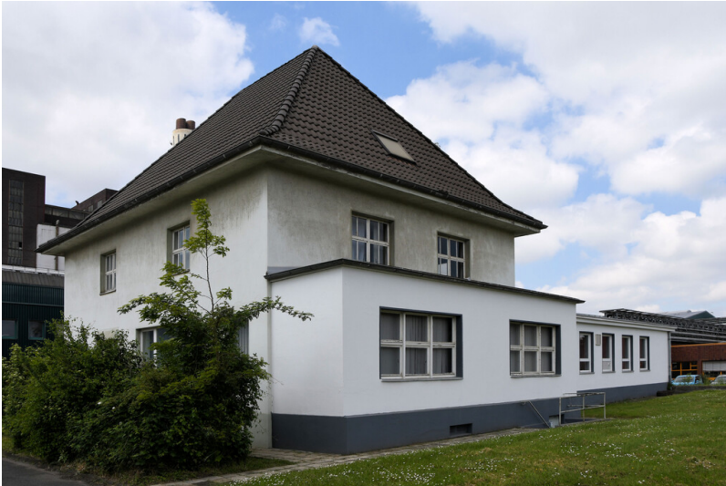
Kraftwerk Goldenberg-Werk: Haus 25 (ehemaliges Betriebsleiter-Wohnhaus) mit Anbau, Ansicht von Osten; Foto: 25.05.2023