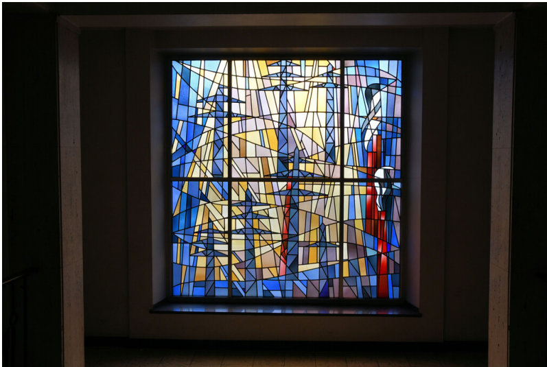
Kraftwerk Goldenberg-Werk: Alte Verwaltung, Glasfenster über dem Haupteingang, Ansicht von Nordwesten; Foto: 25.05.2023