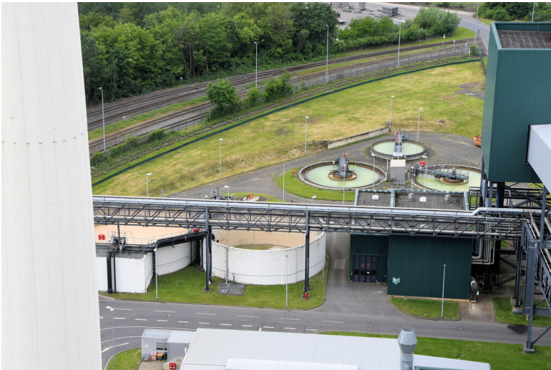
Kraftwerk Goldenberg-Werk: Fangbecken der Kläranlage (links außen), Ansicht von Südosten (vom Dach des Kesselhauses DE K)