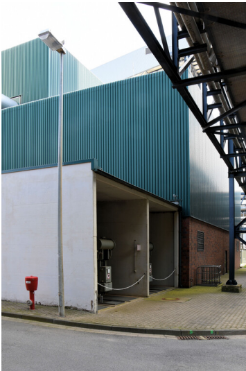
Kraftwerk Goldenberg-Werk: Schaltanlagegebäude für die Hilfsdampferzeuger L/M mit Trafzellen, Ansicht von Süden