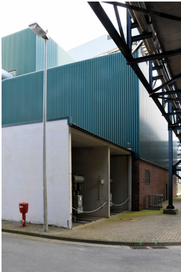
Kraftwerk Goldenberg-Werk: Schaltanlagegebäude für die Hilfsdampferzeuger L/M mit Trafoszellen, Ansicht von Süden; Foto: 25.05.2023