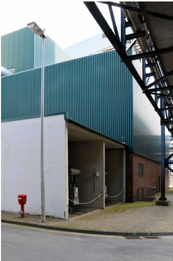
Kraftwerk Goldenberg-Werk: Schaltanlagegebäude für die Hilfsdampferzeuger L/M mit Trafoszellen, Ansicht von Süden; Foto: 25.05.2023