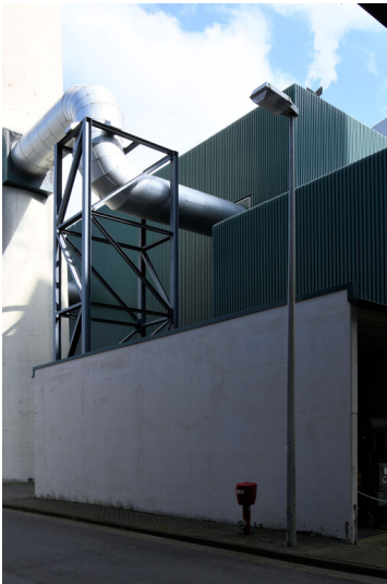
Kraftwerk Goldenberg-Werk: Hilfsdampferzeugergebäude L/M, Abgaseinleitung in den Kamin L/M, Ansicht von Süden