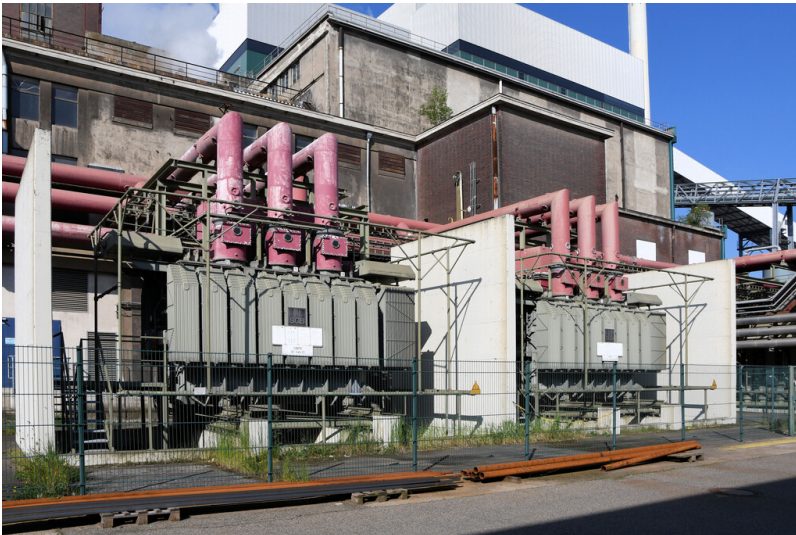
Kraftwerk Goldenberg-Werk: Eigenbedarfstransformator E3 (links) und F3 (rechts), Ansicht von Osten