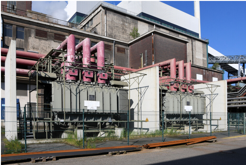
Kraftwerk Goldenberg-Werk: Eigenbedarfstransformator E3 (links) und F3 (rechts), Ansicht von Osten; Foto: 25.05.2023