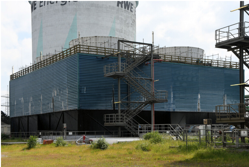
Kraftwerk Goldenberg-Werk: Kühler 2, Ansicht von Südwesten; Foto: 25.05.2023