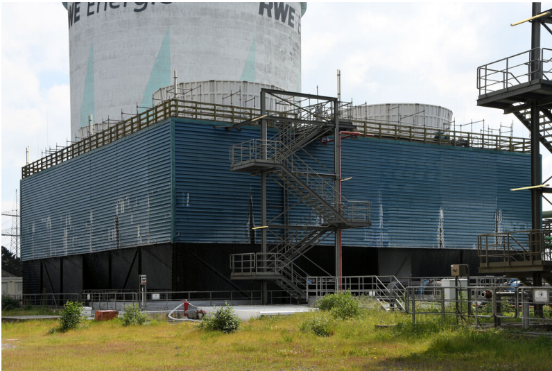
Kraftwerk Goldenberg-Werk: Kühler 2, Ansicht von Südwesten