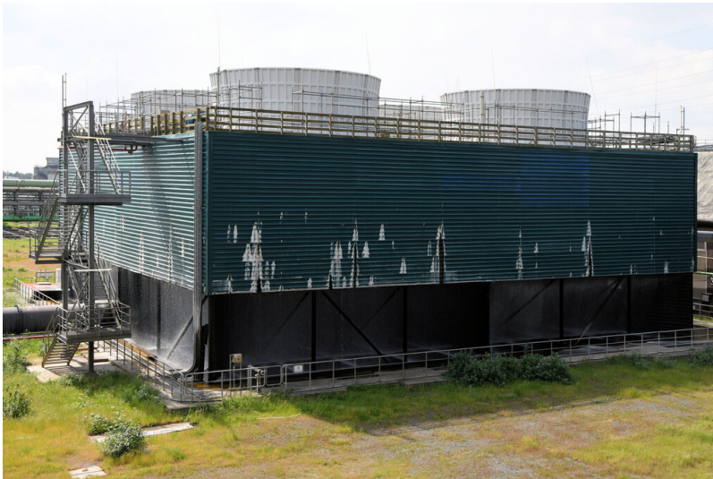
Kraftwerk Goldenberg-Werk: Kühler 1, Ansicht von Norden; Foto: 25.05.2023