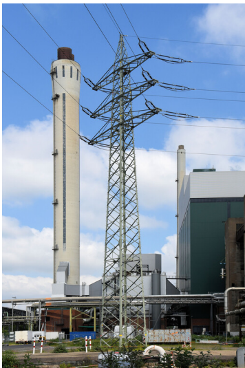
Kraftwerk Goldenberg-Werk: 110-kV-Hochspannungsfreileitung Go-Werk - Kierdorf (Bauleitnummer 0084), Mast 1C, Ansicht von Südosten; Foto: 25.05.2023