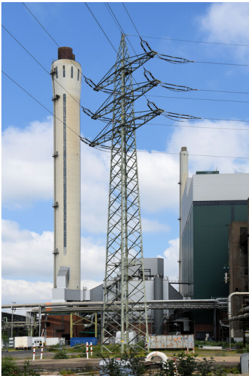
Kraftwerk Goldenberg-Werk: 110-kV-Hochspannungsfreileitung Go-Werk - Kierdorf (Bauleitnummer 0084), Mast 1C, Ansicht von Südosten