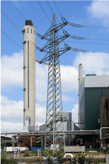
Kraftwerk Goldenberg-Werk: 110-kV-Hochspannungsfreileitung Go-Werk - Kierdorf (Bauleitnummer 0084), Mast 1C, Ansicht von Südosten; Foto: 25.05.2023