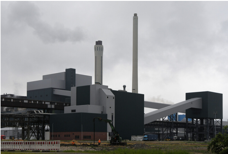
Kraftwerk Goldenberg-Werk: Bekohlungsweg vom PD Brechereigebäude zum PD Bekohlungseckturm (rechte Bildhälfte), Ansicht von Norden; Foto: 23.05.2023