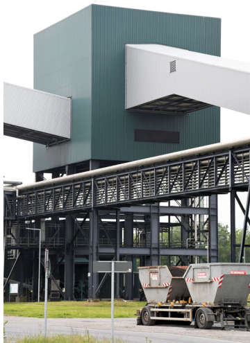
Kraftwerk Goldenberg-Werk: PD Bekohlungsseckturm, Ansicht von Osten