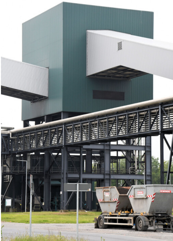
Kraftwerk Goldenberg-Werk: PD Bekohlungseckturn, Ansicht von Osten; Foto: 23.05.2023