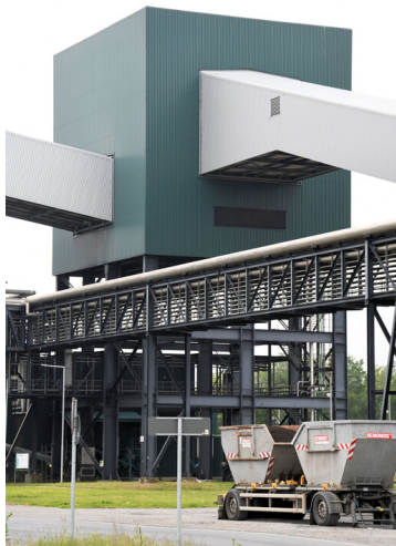
Kraftwerk Goldenberg-Werk: PD Bekohlungsseckturm, Ansicht von Osten; Foto: 23.05.2023