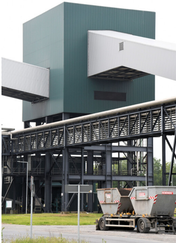
Kraftwerk Goldenberg-Werk: PD Bekohlungsseckturm, Ansicht von Osten