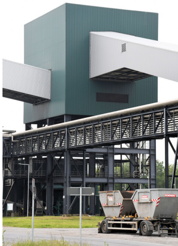
Kraftwerk Goldenberg-Werk: PD Bekohlungsseckturm, Ansicht von Osten; Foto: 23.05.2023