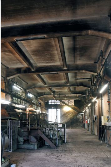
Kraftwerk Goldenberg-Werk: Nachbrechergebäude, Raum für die Aufstellung der Brecher; Foto: 23.05.2023