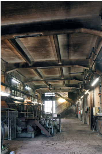
Kraftwerk Goldenberg-Werk: Nachbrechergebäude, Raum für die Aufstellung der Brecher; Foto: 23.05.2023