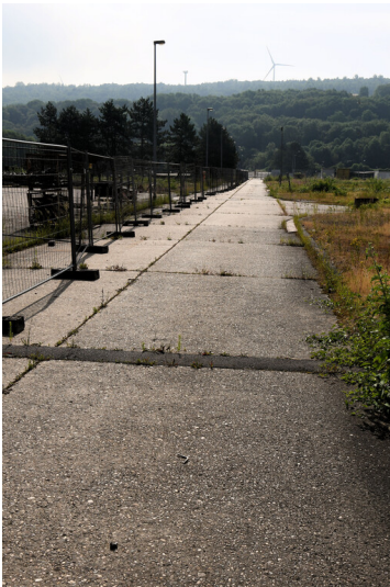
Kraftwerk Frimmersdorf II: Bekohlungsstraße, in Richtung L 375 führend, Ansicht von Westen; Foto: 23.06.2023