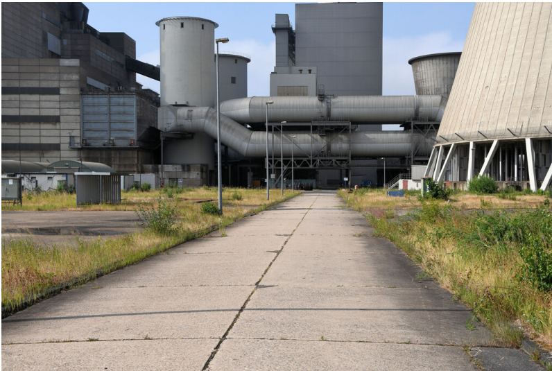
Kraftwerk Frimmersdorf II: Kühlturmstraße 3, Ansicht von Norden; Foto: 23.06.2023