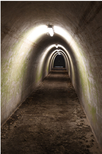
Kraftwerk Frimmersdorf II: Fußgängertunnel, Ansicht von Norden