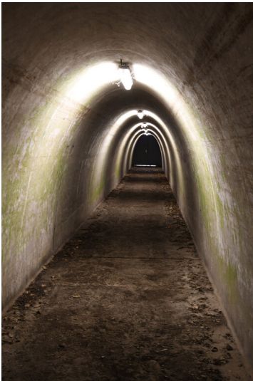
Kraftwerk Frimmersdorf II: Fußgängertunnel, Ansicht von Norden; Foto: 22.03.2023