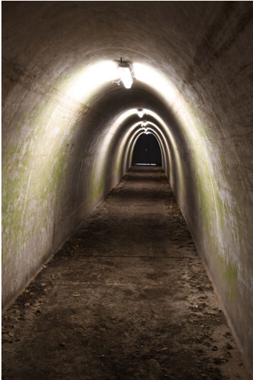
Kraftwerk Frimmersdorf II: Fußgängertunnel, Ansicht von Norden; Foto: 22.03.2023