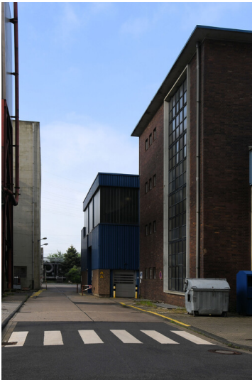
Kraftwerk Frimmersdorf II: Werkstraße, zwischen Lager/Werkstatt I und Bekohlungsbandbrücke hindurchführend, Ansicht von Norden; Foto: 23.06.2023