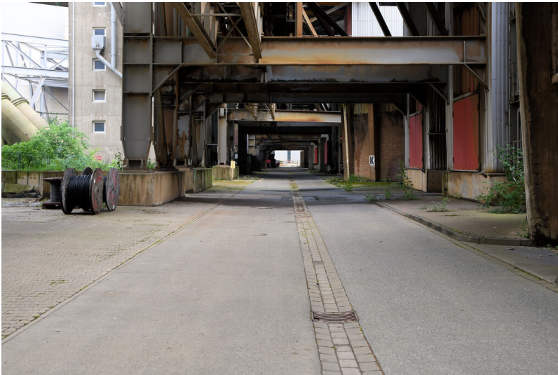
Kraftwerk Frimmersdorf II: Werkstraße (Kaminstraße), zwischen den Schornstein-Fundamentsockeln und den Kühlwasser-Pumpenhäusern verlaufend, Ansicht von Süden; Foto: 23.06.2023