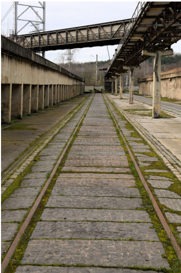
Kraftwerk Frimmersdorf II: Werkgleis, ehemaliges Ascheverladegleis von Ascheabsetzbecken 1 (I-III), Ansicht von Nordosten