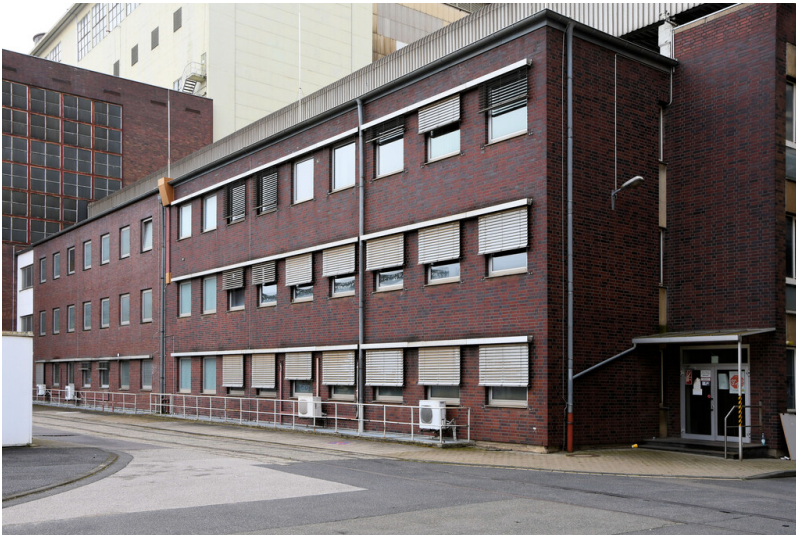
Kraftwerk Frimmersdorf II: Sozialgebäude, Ansicht von Nordosten; Foto: 21.03.2023