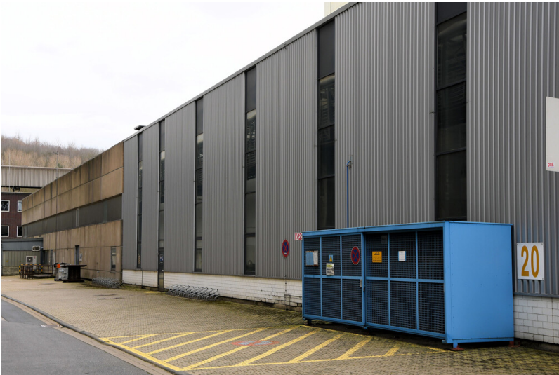
Kraftwerk Frimmersdorf II: Hauptwerkstatt II, Ansicht von Nordwesten; Foto: 22.03.2023