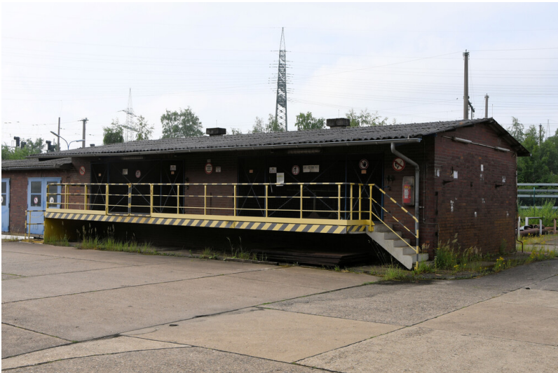
Kraftwerk Frimmersdorf II: Freilager, westlicher Gebädetrakt mit Verladerrampe, Ansicht von Norden