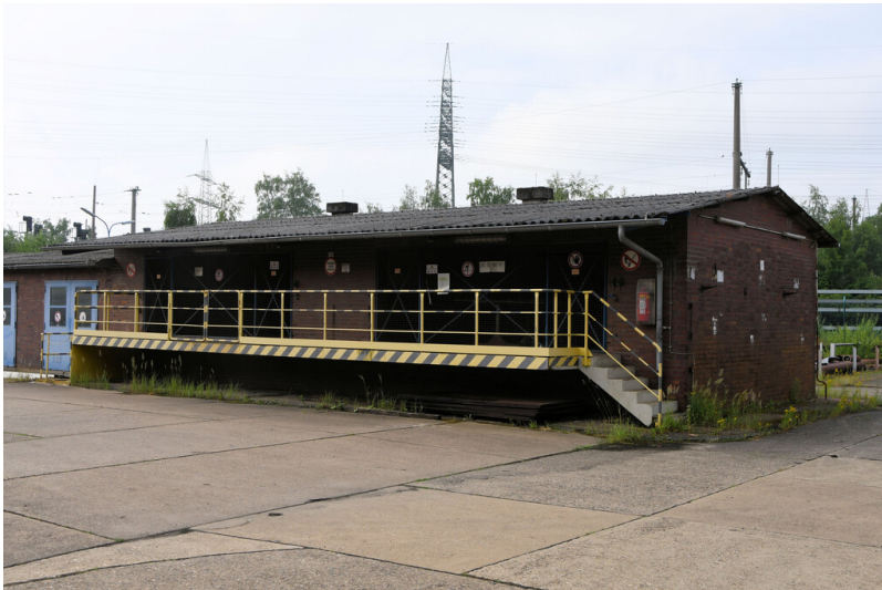
Kraftwerk Frimmersdorf II: Freilager, westlicher Gebädetrakt mit Verladerrampe, Ansicht von Norden; Foto: 23.06.2023