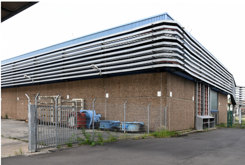
Kraftwerk Frimmersdorf II: Außenlager, Ansicht von Nordosten; Foto: 23.06.2023