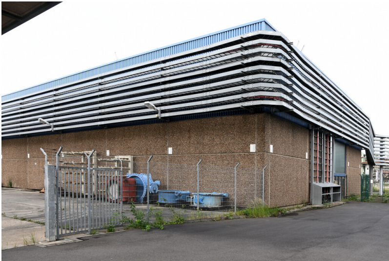
Kraftwerk Frimmersdorf II: Außenlager, Ansicht von Nordosten; Foto: 23.06.2023