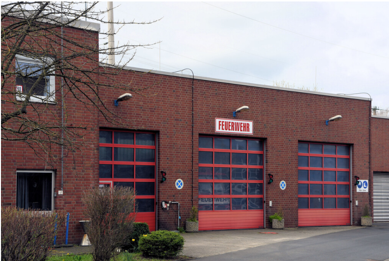
Kraftwerk Frimmersdorf II: Feuerwehrgebäude, Detailansicht von Nordosten