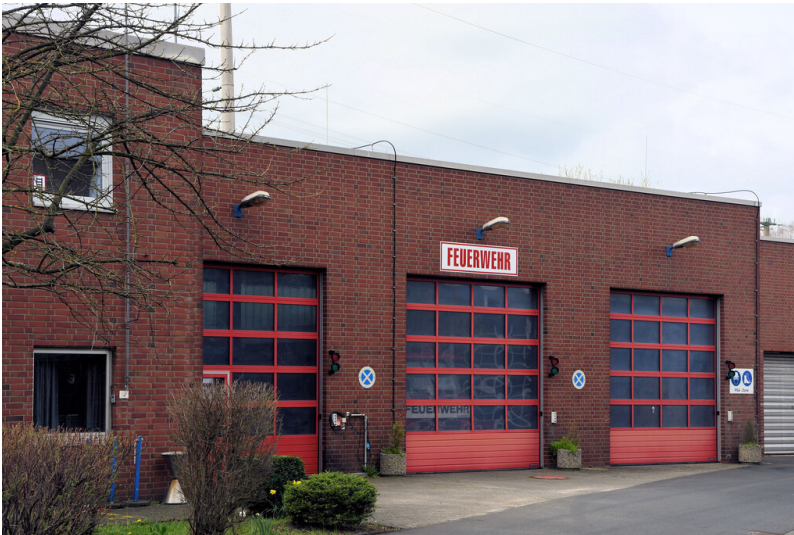
Kraftwerk Frimmersdorf II: Feuerwehrgebäude, Detailansicht von Nordosten; Foto: 22.03.2023