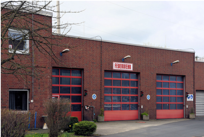
Kraftwerk Frimmersdorf II: Feuerwehrgebäude, Detailansicht von Nordosten