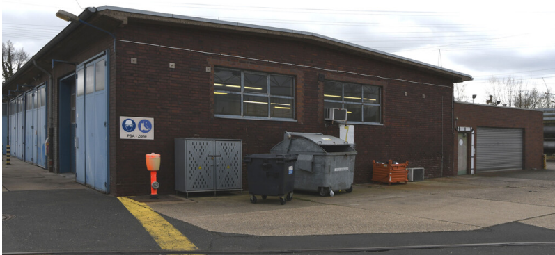
Kraftwerk Frimmersdorf II: Garagen / Kfz-Werkstatt, Ansicht von Nordwesten