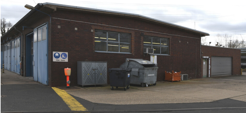
Kraftwerk Frimmersdorf II: Garagen / Kfz-Werkstatt, Ansicht von Nordwesten; Foto: 22.03.2023