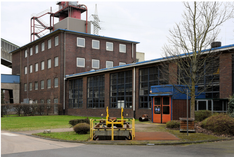
Kraftwerk Frimmersdorf II: Lager / Werkstatt I, Ansicht von Nordwesten; Foto: 22.03.2023