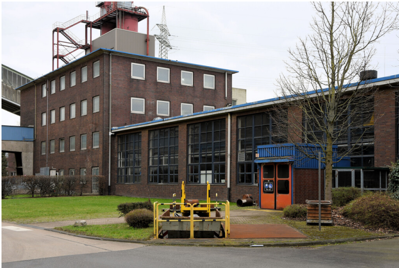
Kraftwerk Frimmersdorf II: Lager / Werkstatt I, Ansicht von Nordwesten; Foto: 22.03.2023