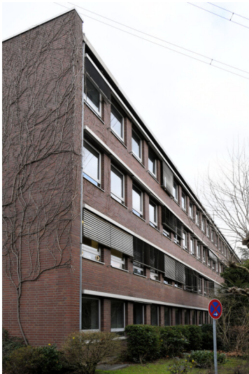
Kraftwerk Frimmersdorf II: Verwaltungsgebäude, südlicher Erweiterungsbau, Ansicht von Südosten