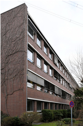
Kraftwerk Frimmersdorf II: Verwaltungsgebäude, südlicher Erweiterungsbau, Ansicht von Südosten; Foto: 22.03.2023