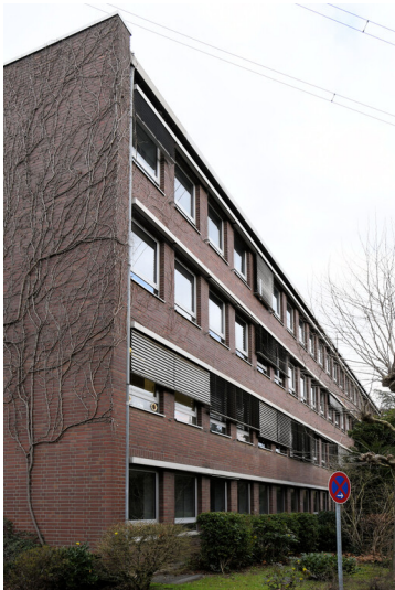
Kraftwerk Frimmersdorf II: Verwaltungsgebäude, südlicher Erweiterungsbau, Ansicht von Südosten; Foto: 22.03.2023