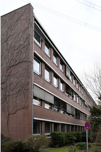
Kraftwerk Frimmersdorf II: Verwaltungsgebäude, südlicher Erweiterungsbau, Ansicht von Südosten