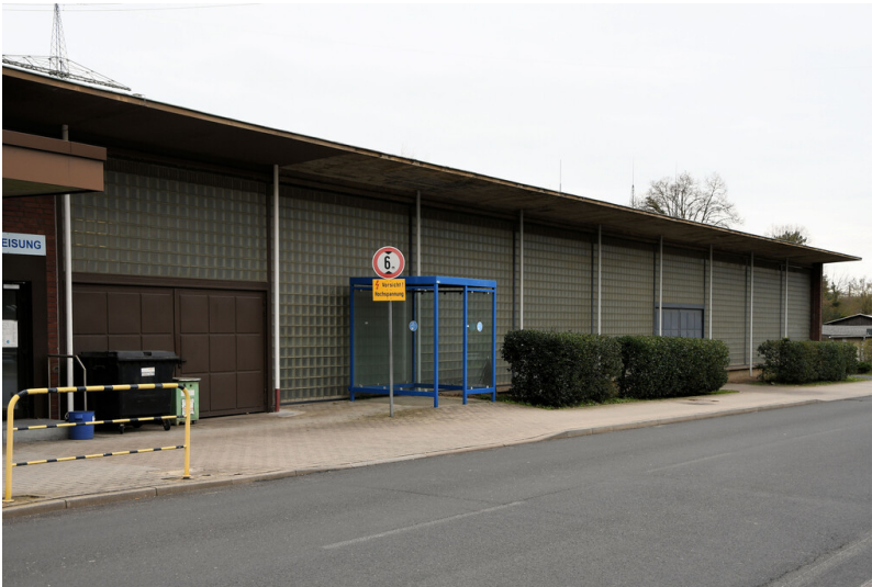
Kraftwerk Frimmersdorf II: Motorrad- und Fahrradhalle, Ansicht von Norden; Foto: 22.03.2023