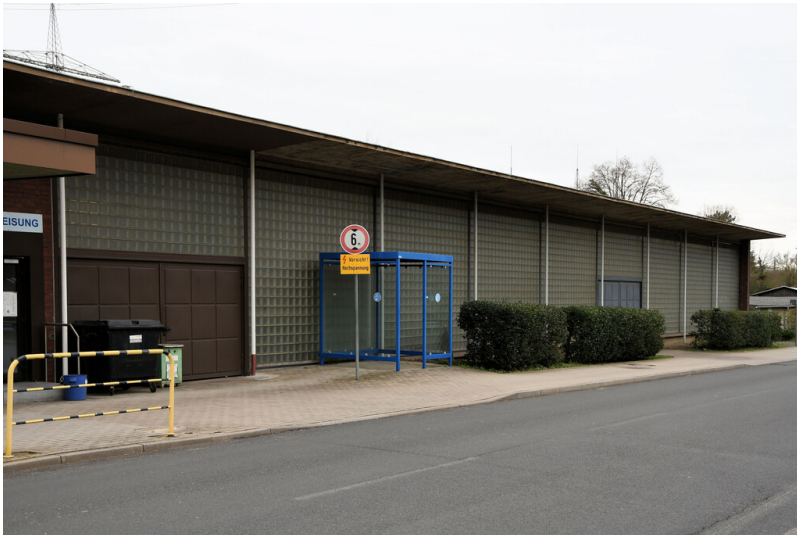
Kraftwerk Frimmersdorf II: Motorrad- und Fahrradhalle, Ansicht von Norden; Foto: 22.03.2023