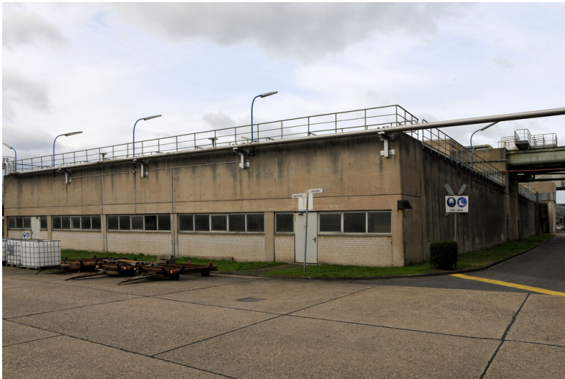
Kraftwerk Frimmersdorf II: Wasseraufbereitung, Pulsatoranlage, Ansicht von Osten