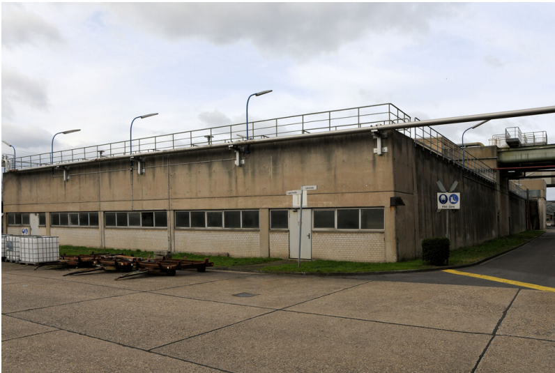
Kraftwerk Frimmersdorf II: Wasseraufbereitung, Pulsatoranlage, Ansicht von Osten; Foto: 22.03.2023