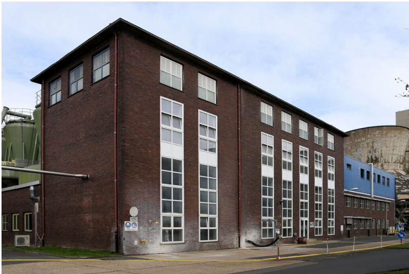
Kraftwerk Frimmersdorf II: Wasseraufbereitung, Kopfbau des Silotraktes, Ansicht von Südosten