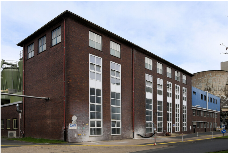
Kraftwerk Frimmersdorf II: Wasseraufbereitung, Kopfbau des Silotraktes, Ansicht von Südosten; Foto: 22.03.2023