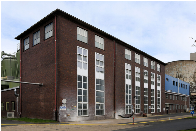
Kraftwerk Frimmersdorf II: Wasseraufbereitung, Kopfbau des Silotraktes, Ansicht von Südosten; Foto: 22.03.2023