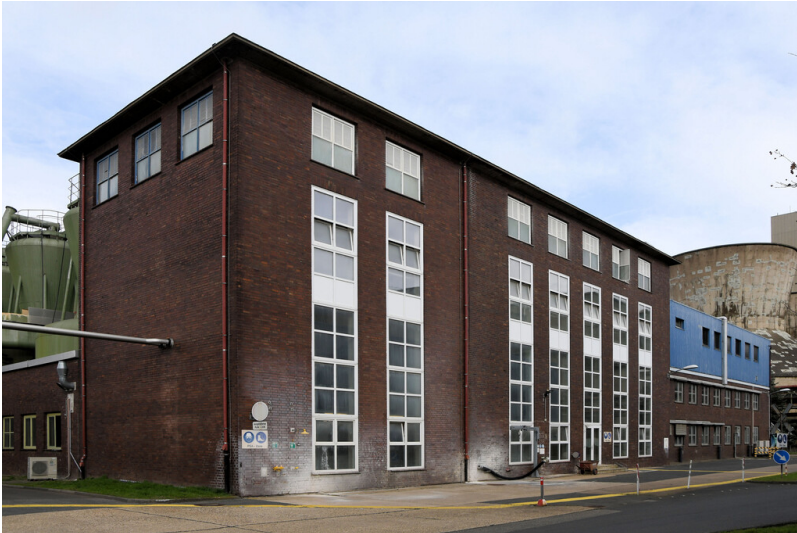
Kraftwerk Frimmersdorf II: Wasseraufbereitung, Kopfbau des Silotraktes, Ansicht von Südosten; Foto: 22.03.2023