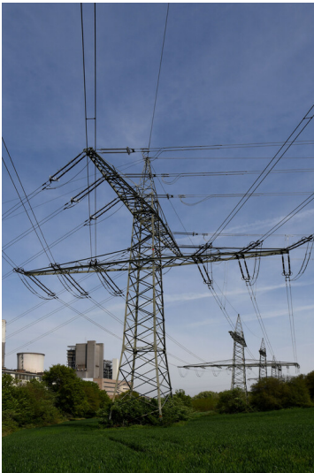
Kraftwerk Frimmersdorf II: Abspannmast 32B (im Vordergrund) sowie 32C, 32D und 32E (im Hintergrund), Ansicht von Süden