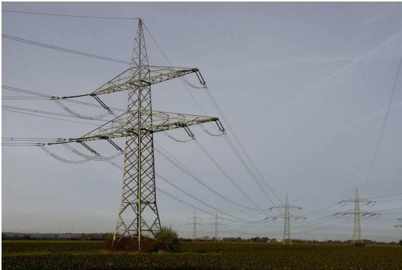
Kraftwerk Frimmersdorf II: Abspannmast 1 der Leitung Bl-Nr. 4535 an der Umspannanlage Rommerskirchen, jetzt Einführung der 380-kV-Leitung von Block F/G Kraftwerk Neurath (linke Traverse) sowie einer weiteren Leitung (rechte Traverse), Ansicht von Norden; Foto: 22.11.2023