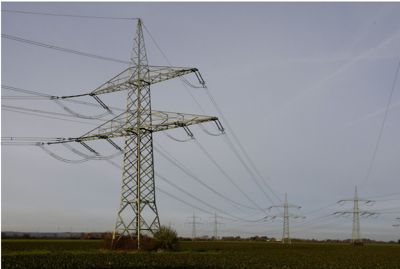
Kraftwerk Frimmersdorf II: Abspannmast 1 der Leitung Bl-Nr. 4535 an der Umspannanlage Rommerskirchen, jetzt Einführung der 380-kV-Leitung von Block F/G Kraftwerk Neurath (linke Traverse) sowie einer weiteren Leitung (rechte Traverse), Ansicht von Norden; Foto: 22.11.2023