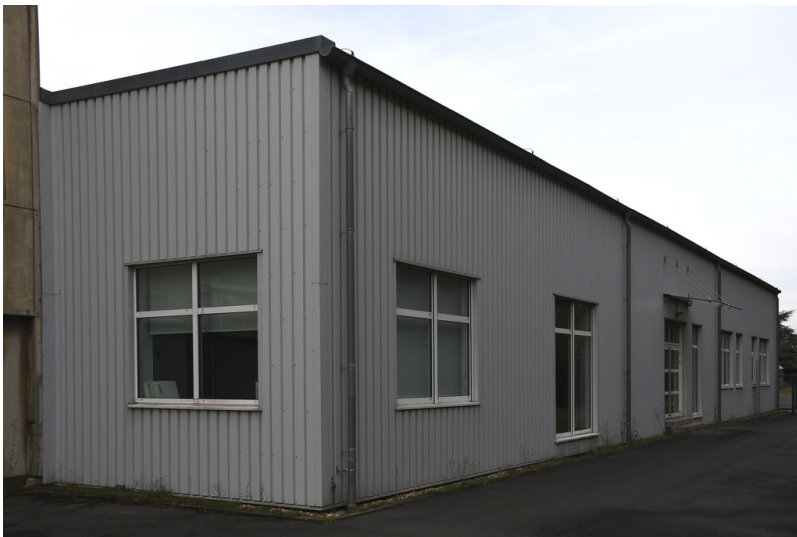
Kraftwerk Frimmersdorf II: Neue E-Warte, Ansicht von Süden; Foto: 21.03.2023