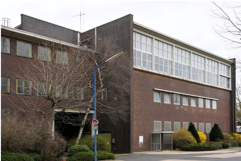
Kraftwerk Frimmersdorf II: E-Warte (rechts) und Zentralwarte (links), Ansicht von Südwesten; Foto: 21.03.2023